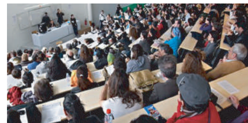
Le Site info

Des modules de soutien aux compétences linguistiques, personnelles et horizontales seront généralisés, dès la prochaine rentrée universitaire, dans les établissements d'enseignement supérieur, a indiqué, mardi à la Chambre des Conseillers, le ministre de l'Enseignement supérieur, de la Recherche scientifique et de l'Innovation, Abdellatif Miraoui. En réponse à une question orale du groupe du Rassemblement National des indépendants (RNI) sur « l'adaptation de la formation universitaire aux exigences du marché du travail », Miraoui a expliqué que le gouvernement accorde une importance capitale au renforcement des compétences linguistiques, des aptitudes personnelles et des compétences horizontales des étudiants universitaires.