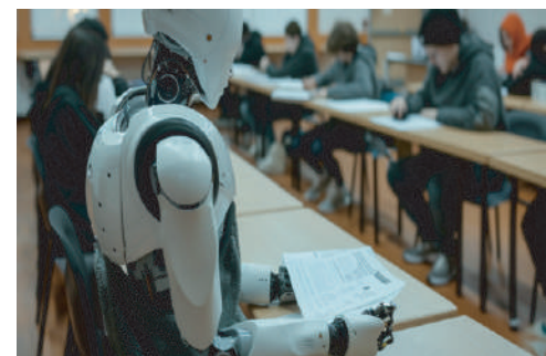
Le Big data

Une récente recherche menée par une équipe de l'université de Reading, en Angleterre, révèle que l'intelligence artificielle surpasse désormais les étudiants d'université. ChatGPT arrive effectivement à obtenir de meilleures notes. Par ailleurs, les réponses de l'intelligence artificielle étaient indétectables dans 94 % des cas. « Cette situation est particulièrement inquiétante », écrivent les auteurs de la recherche dans un papier. Vous pouvez en consulter les détails dans la revue PLOS ONE. Ils soulèvent notamment la possibilité pour les étudiants de tricher avec l'intelligence artificielle. La tricherie pourrait alors passer inaperçue.