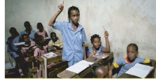
« L'anglais dès l'école primaire »